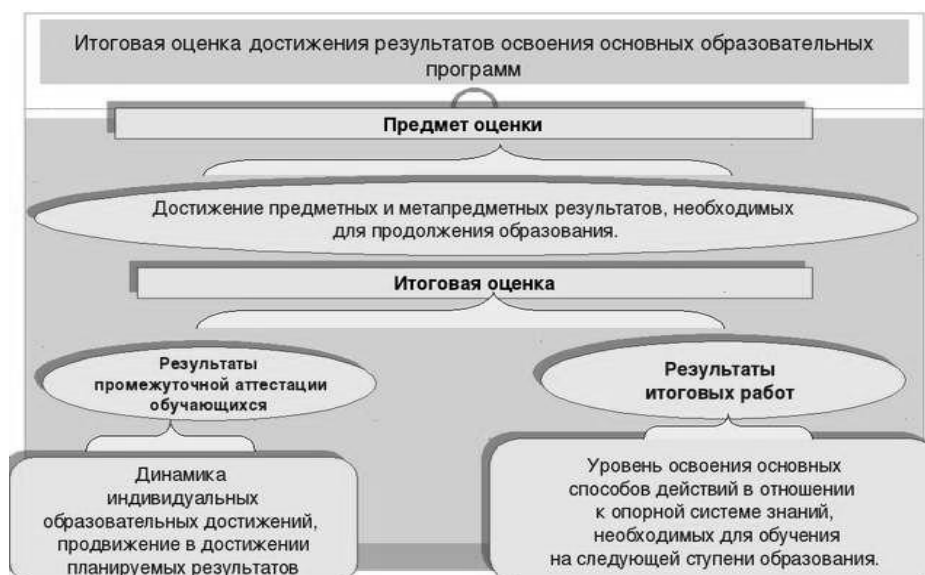
Рис. 3. Достижение предметных и метапредметных результатов, необходимых для продолжения образования. Итоговая оценка.

На итоговую оценку на уровне основного общего образования выносятся только предметные и метапредметные результаты , описанные в разделе «Выпускник научится» планируемых результатов основного общего образования.